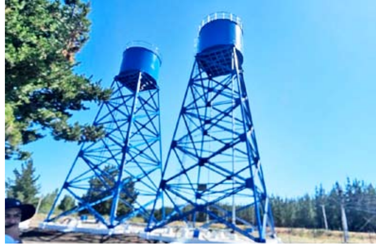
Más de 1.581 familias de la región serán beneficiadas durante este 2025.

"Estamos muy contentos de poder transmitirle a la comunidad de los servicios sanitarios rurales, que por fin