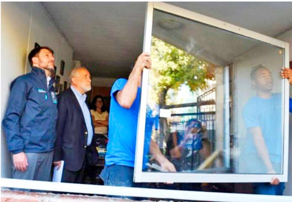
Este beneficio permite mejoras en revestimientos, techumbres y métodos de calefacción.

Vecinos acusan que no se ha cumplido con los plazos del decreto 255, el que ya estaría financiado. Seremi responde que los denunciantes no tenían asignados los beneficios, sino que estaban calificados para ser llamados.