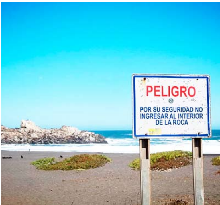
El resguardo de los lobos marinos y la protección de aves playeras durante sus periodos de anidación son prioridades clave.

Servicios públicos y organizaciones ambientales fomentan la conservación marina y la acción comunitaria en el Santuario Islote Lobería e Iglesia de Piedra.