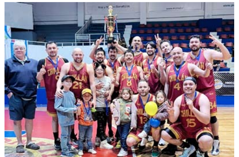
El equipo seniors 35 años de Chillán representará a Chile en el Mundial.

“Fuimos apenas superados por Concepción, por dos puntos, al igual que Arica por el mismo resultado.