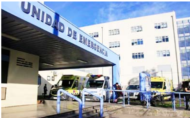
El miércoles empezó con dolor de estómago y la fiebre llegó a 39.5.

“El miércoles empezó con dolor de estómago y la fiebre llegó a 39.5 no le bajaba de eso, por lo tanto, lo llevamos al SAPU del Federico Puga, donde lo atendieron al tiro. En una sala le intentaron bajar la fiebre con pañitos fríos. Le inyectaron un remedio en sus glúteos y vía oral le dieron paracetamol y le pudo bajar la fiebre. En los papeles estaba registrado que tenía gastroenteritis. Le entregaron paracetamol, ibuprofeno y domperidona, más otro medicamento a comprar. Pasaron dos días