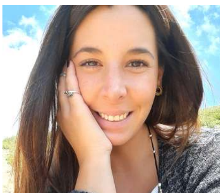
¡Ellas fueron Mujeres de Ñuble! Repaso por las increíbles historias de aquellas que nos inspiraron en el Instagram @mujeresdenable