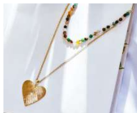
Collar Jacinta: $29.990