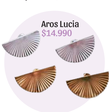
Aros Lucia $14.990

Instagram: @matriarcado_jewelry Web: www.matriarcadojewelry.cl Dirección: Hacienda Quilamapu