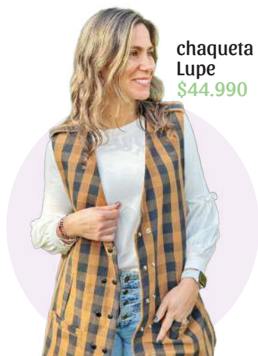
chaqueta Lupe $44.990