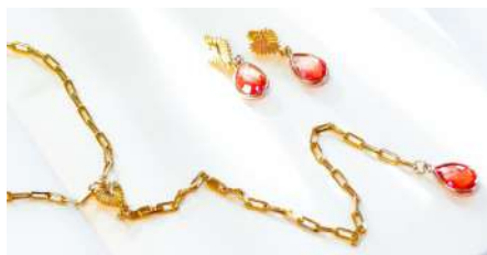
Moda Abrigarse con estilo