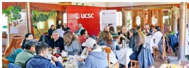
El evento se realizó en la comuna de San Nicolás, en la Granja Educativa Lo Vilches.