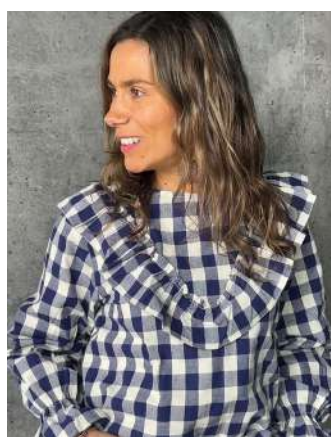
blusa Candelaria $35.990

@binah_cl Dirección: km 1 camino a Cato, espacio Cubo, tienda Mondo