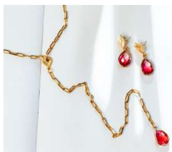
Collar Francisca: $36.000