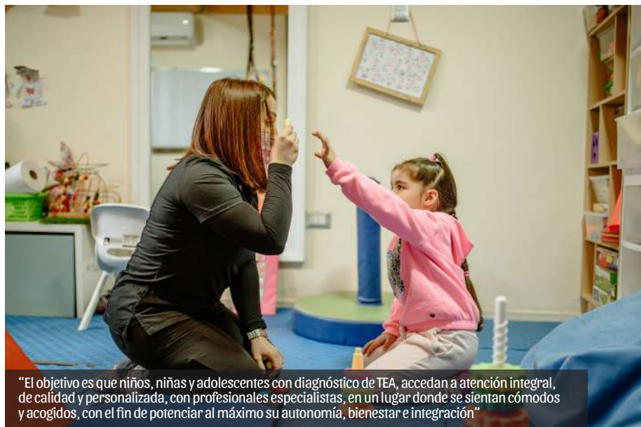
“El objetivo es que niños, niñas y adolescentes con diagnóstico de TEA, accedan a atención integral, de calidad y personalizada, con profesionales especialistas, en un lugar donde se sientan cómodos y acogidos, con el fin de potenciar al máximo su autonomía, bienestar e integración”