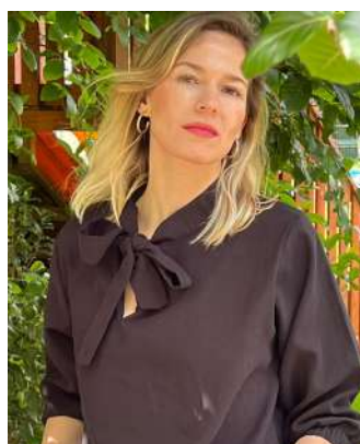
polera Calú $28.990