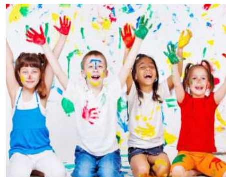
Día del niño Datos para comprar el regalo perfecto