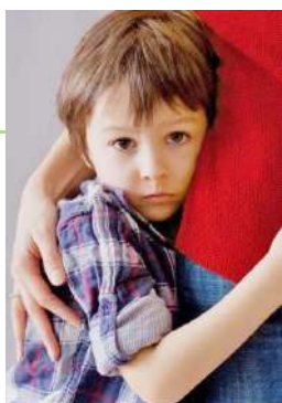
Bienestar Descubre cómo manejar la ansiedad en nuestros hijos