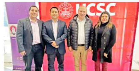
Te mostramos los últimos eventos realizados para capacitar y educar a la región