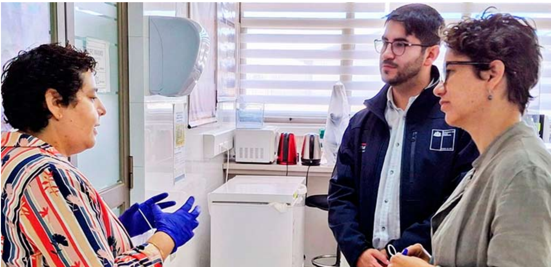
Grupo conoció las dos áreas más críticas en eventos de emergencia ambiental.

Centro es un eje de protección de la biodiversidad y, en particular, de la fauna silvestre en la Región del Biobío, Maule y Ñuble. Grupo conoció principalmente las dos áreas más críticas en eventos de emergencia ambiental.