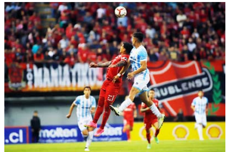
El organismo rector del fútbol sudamericano recalzó que los recintos están sometidos a cambios.

En aquella ocasión, debieron hacer de local en el estadio Collao de Concepción, porque el antiguo Nelson Oyarzún había sido derrumbado para dar vida al nuevo recinto en vísperas del Mundial Femenino del 2008 que acogió la capital regional