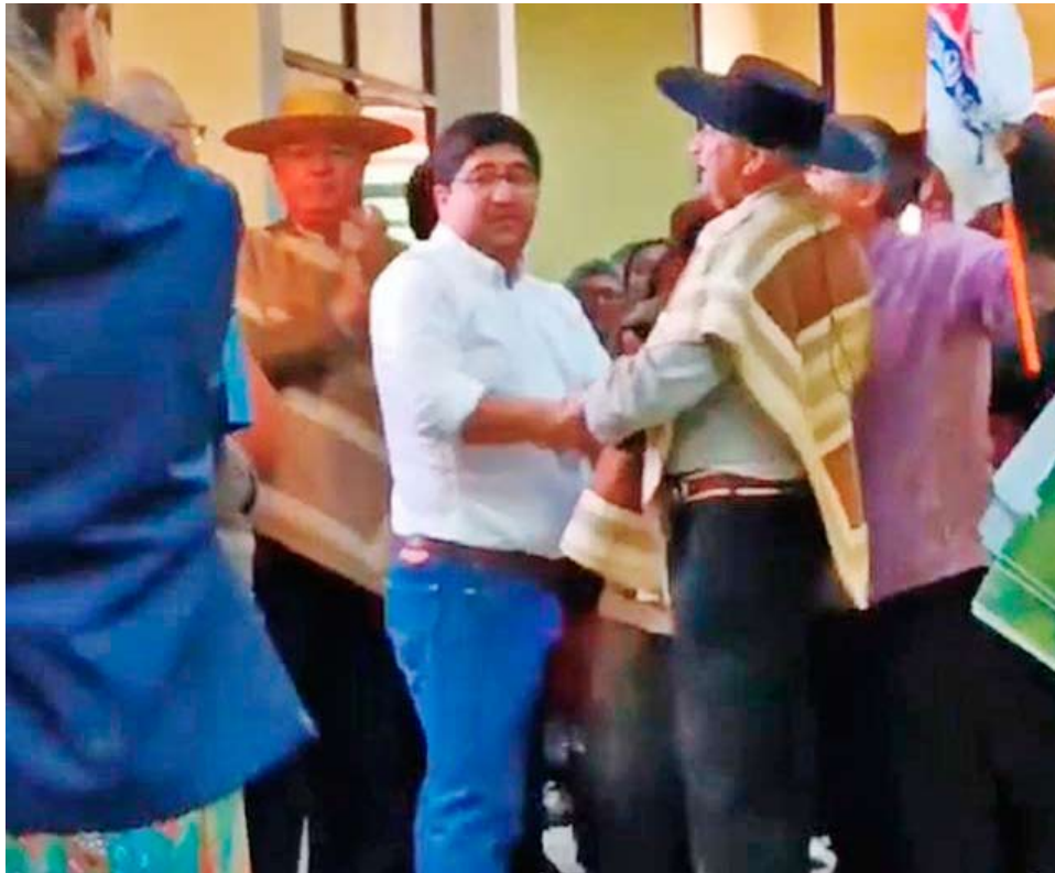
Inicialmente el acto de juramento se realizaría en la plaza de Ñiquén, pero se debió hacer en el municipio.

Junto con felicitar al resto de los concejales, dijo lamentar la ausencia