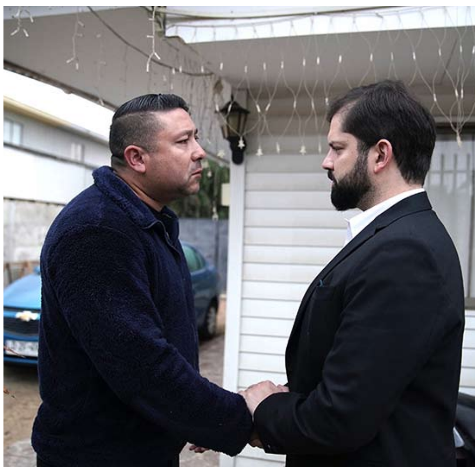
El mandatario visitó a la familia de la sargento en Belloto para entregarle sus condolencias.

Por su parte, la PDI detuvo a tercer sospechoso del crimen de la sargento.