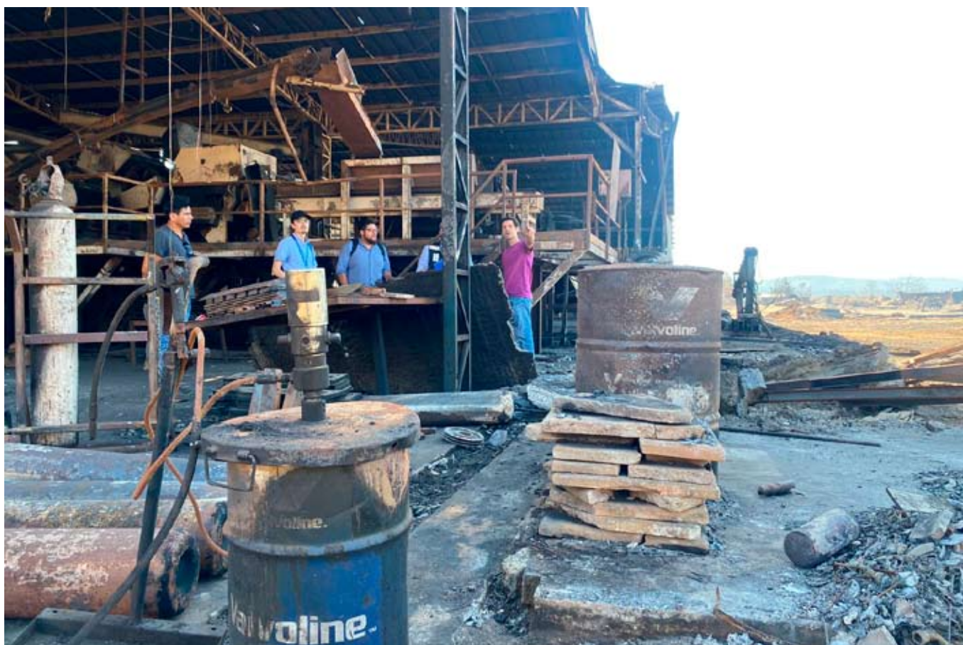
El fuego avanzó con rapidez el pasado 2 de febrero, alcanzando tres aserraderos, una maestranza y casas vecinas.

Recientemente, el gobierno anunció 13 medidas de apoyo a los afectados. Dentro de éstas, están el programa de Alivios y Exenciones Tributarias, el que presenta 10 acciones que permitirán dar un respiro en materia económica a las personas y empresas, y el Subsidio para Continuidad de los Ingresos para trabajadores de MiPymes, el que entregará una bonificación de $328.000 durante tres meses con posibilidad de prórroga.