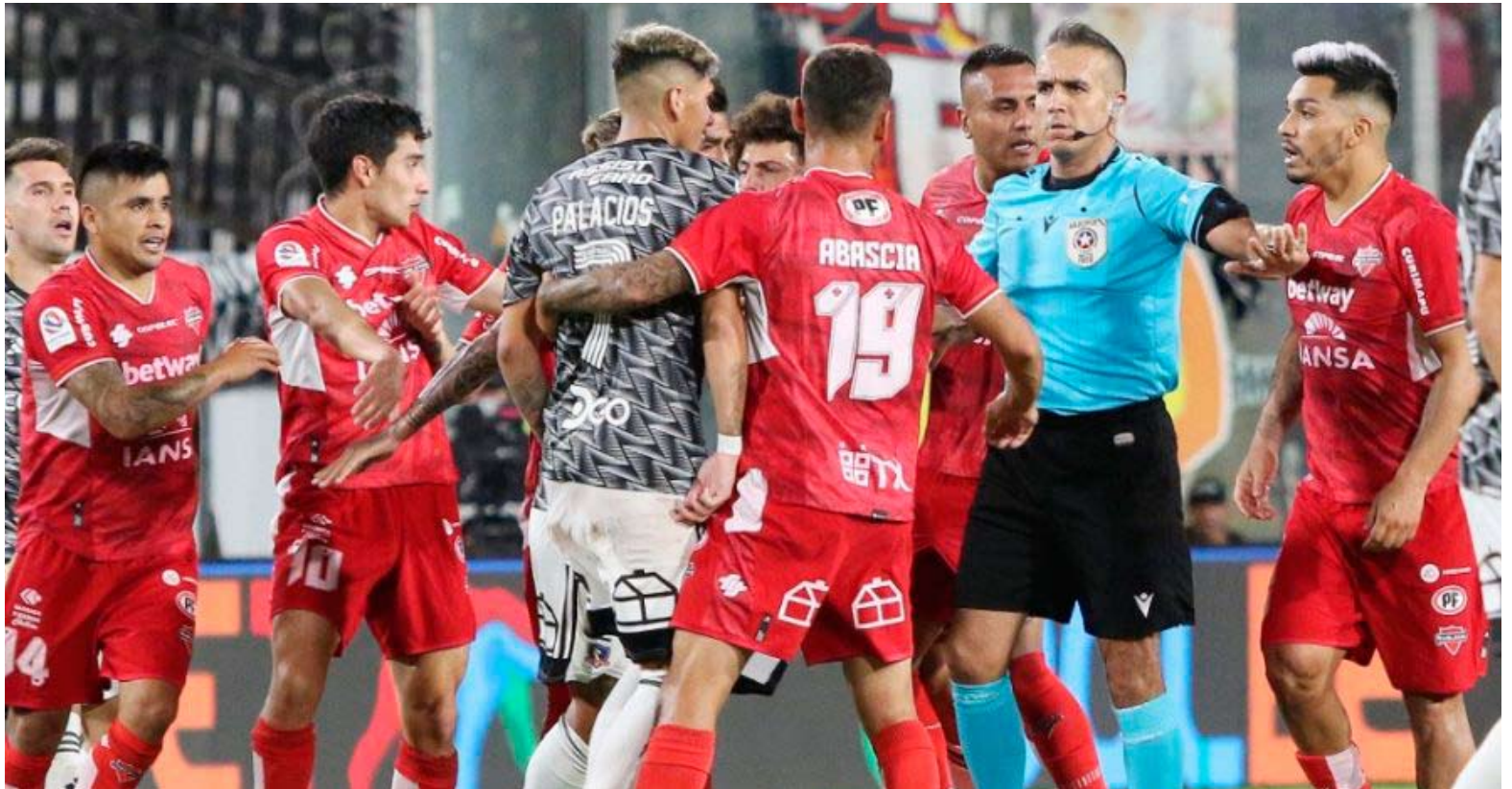
Ñublense perdió por la cuenta mínima ante Colo Colo.