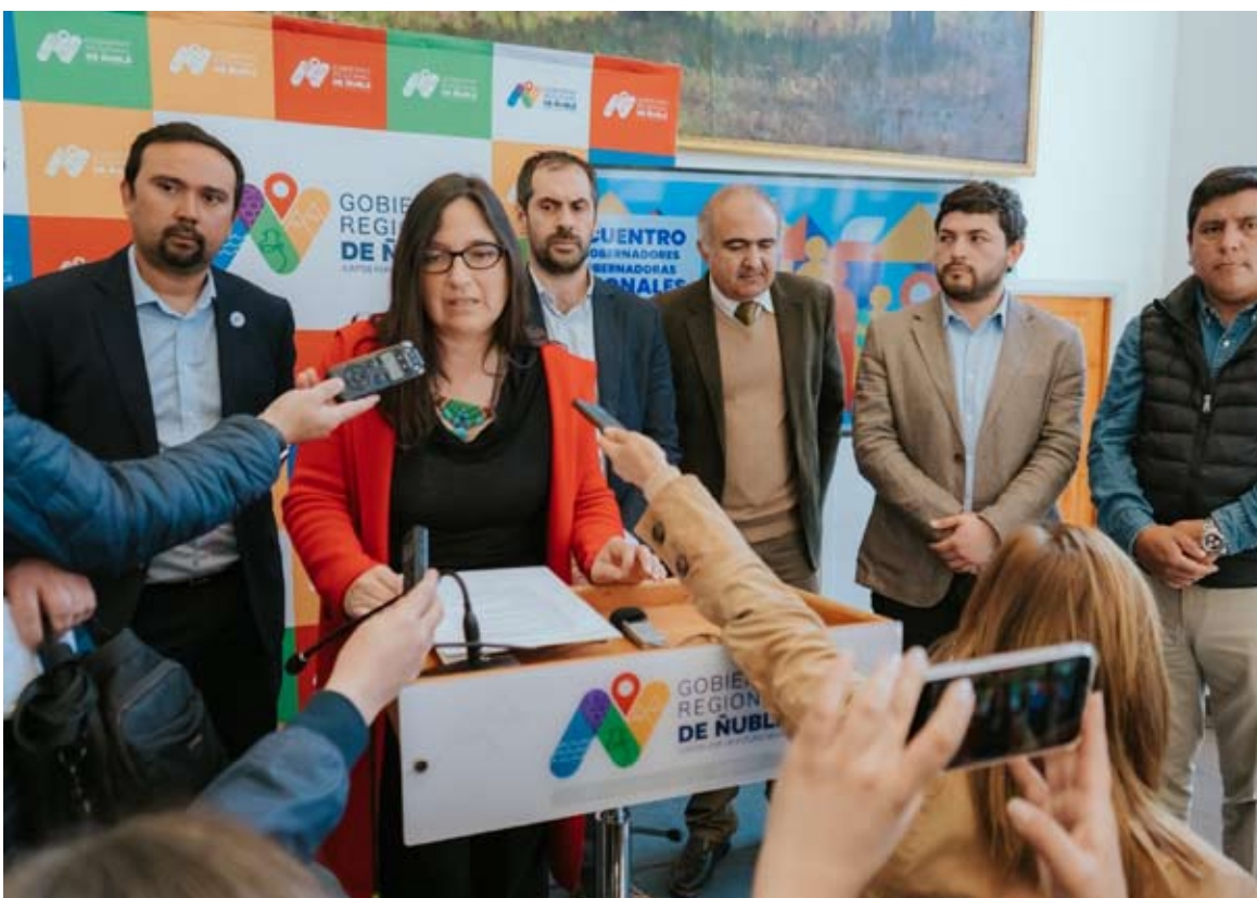
En el anuncio participó el ministro de Economía, el gobernador regional, la directora de Corfo y el presidente de la CChC.