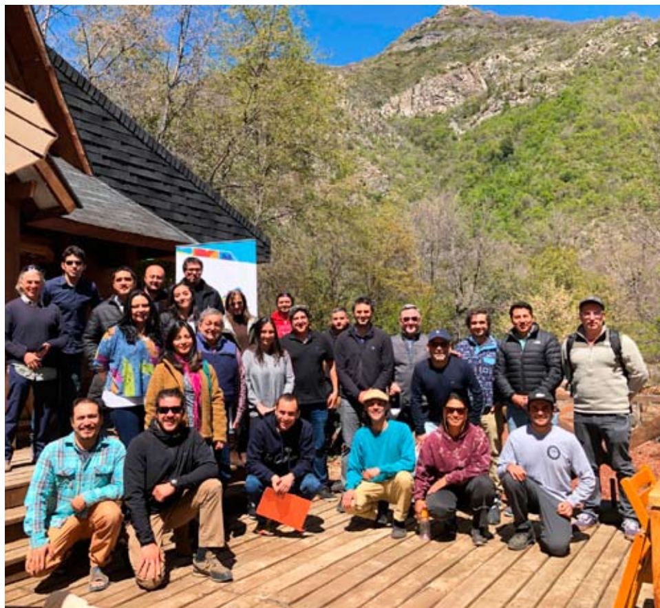
El proyecto Expande Montaña es una iniciativa ejecutada por Esquerré Consultores.

El proyecto Expande Montaña se llevará a cabo en modalidad de talleres presenciales y online, de manera paralela en los destinos Valle Las Trancas y Araucanía Andina. Durante 5 meses, los participantes de las empresas podrán adquirir herramientas en temáticas como: oportunidades de mercado y operaciones internacio-