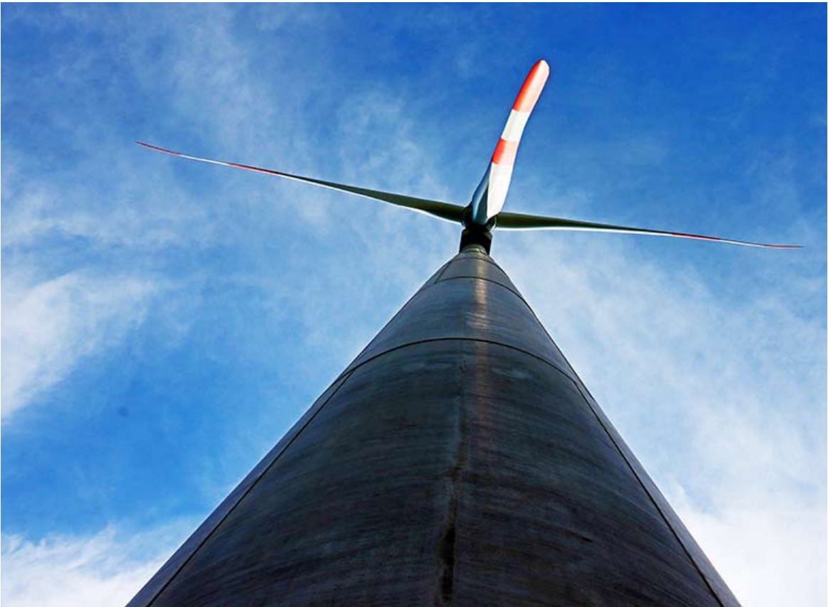
Las 27 torres que sostendrán los aerogeneradores tendrán una altura de 155 metros, sin considerar las aspas.