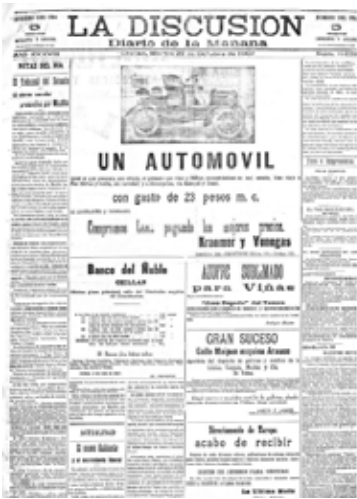
El primer automóvil en Chillán. El 20 de octubre de 1907 LA DISCUSIÓN informaba en su portada del arribo del primer automóvil que, a modo de prueba, hizo dos viajes: a San Carlos y a Concepción, ambos sin contratiempos.