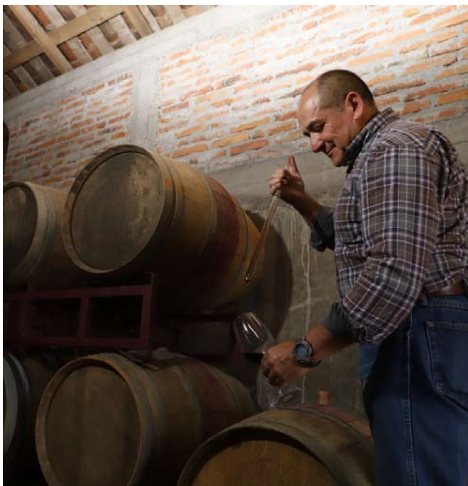
Según Víctor Castellón, esto favorece que las empresas planten estas variedades hacia el norte.