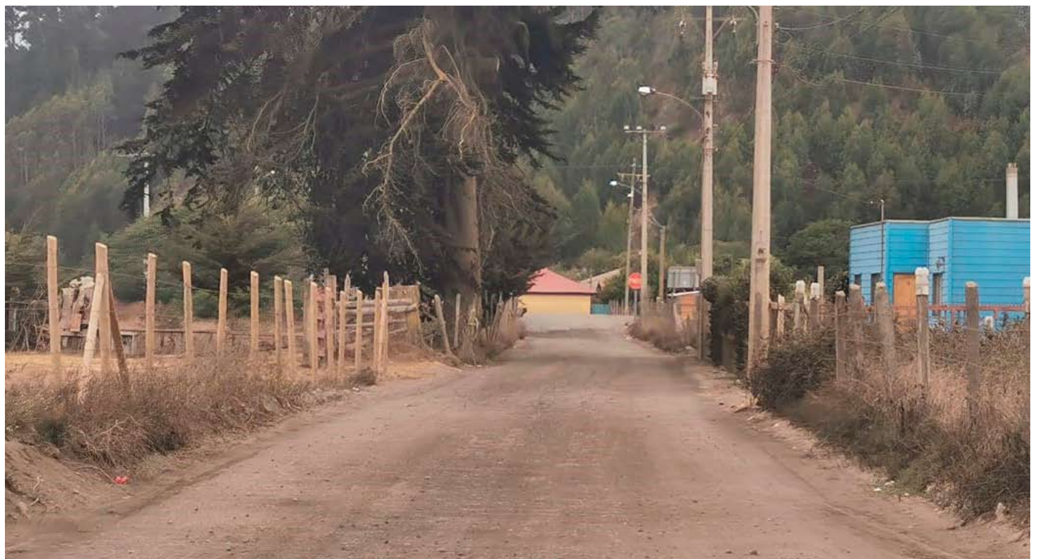
Camino conecta el pueblo de Cobquecura con la Ruta N-450.

COMENTA E INFÓRMATE MÁS EN: www.ladiscusion.cl