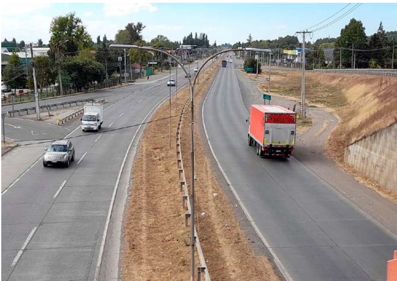
A partir de esta semana comenzaron los trabajos de limpieza de los espacios verde-urbanos de la entrada norte de la capital regional.

“Ayer (el jueves) estuvimos en algunas plazas de la población Vicente Pérez Rosales, de El Tejar, Robinson Ramírez y en otros lugares similares en los que es fácil encontrarse este tipo de placitas, de no más de 80 metros cuadrados, que son lugares que se repiten en muchos sectores y que tienen como problema en común, la falta de mantención, de orden,