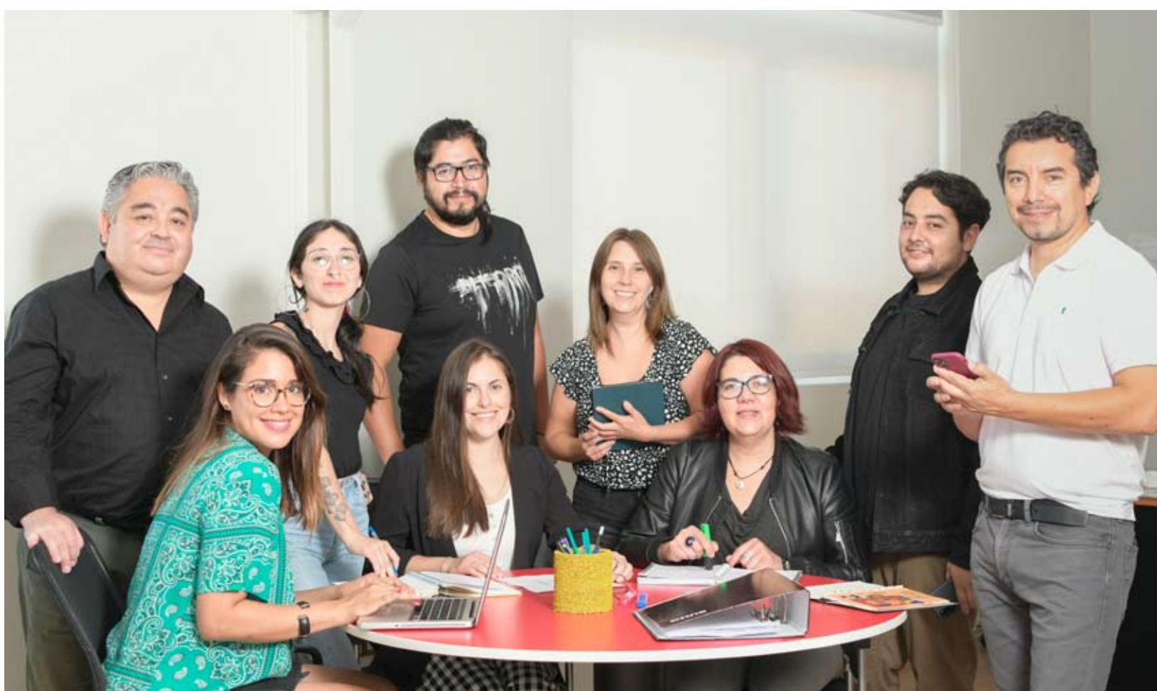
Este es el equipo completo que trabaja en el Centro Cultural Municipal, ahora a la espera del próximo director o directora del espacio.

Posteriormente al cierre de la convocatoria se revisarán todos los antecedentes y documentación recibida, dejando exclusivamente a