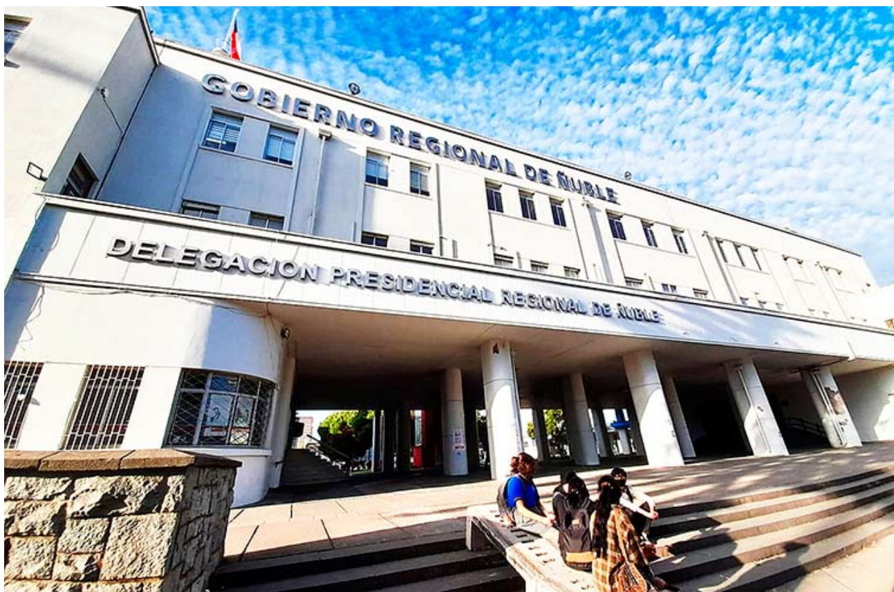
El próximo viernes asumirá el nuevo gobierno de Apruebo Dignidad, encabezado por Gabriel Boric.

Es más, la autoridad regional precisó que se dio inicio a un proceso de inducción en el pleno del Consejo Regional, “porque el espíritu que tenemos es de colaboración y poder generar las confianzas para trabajar mancomunadamente por los próximos tres