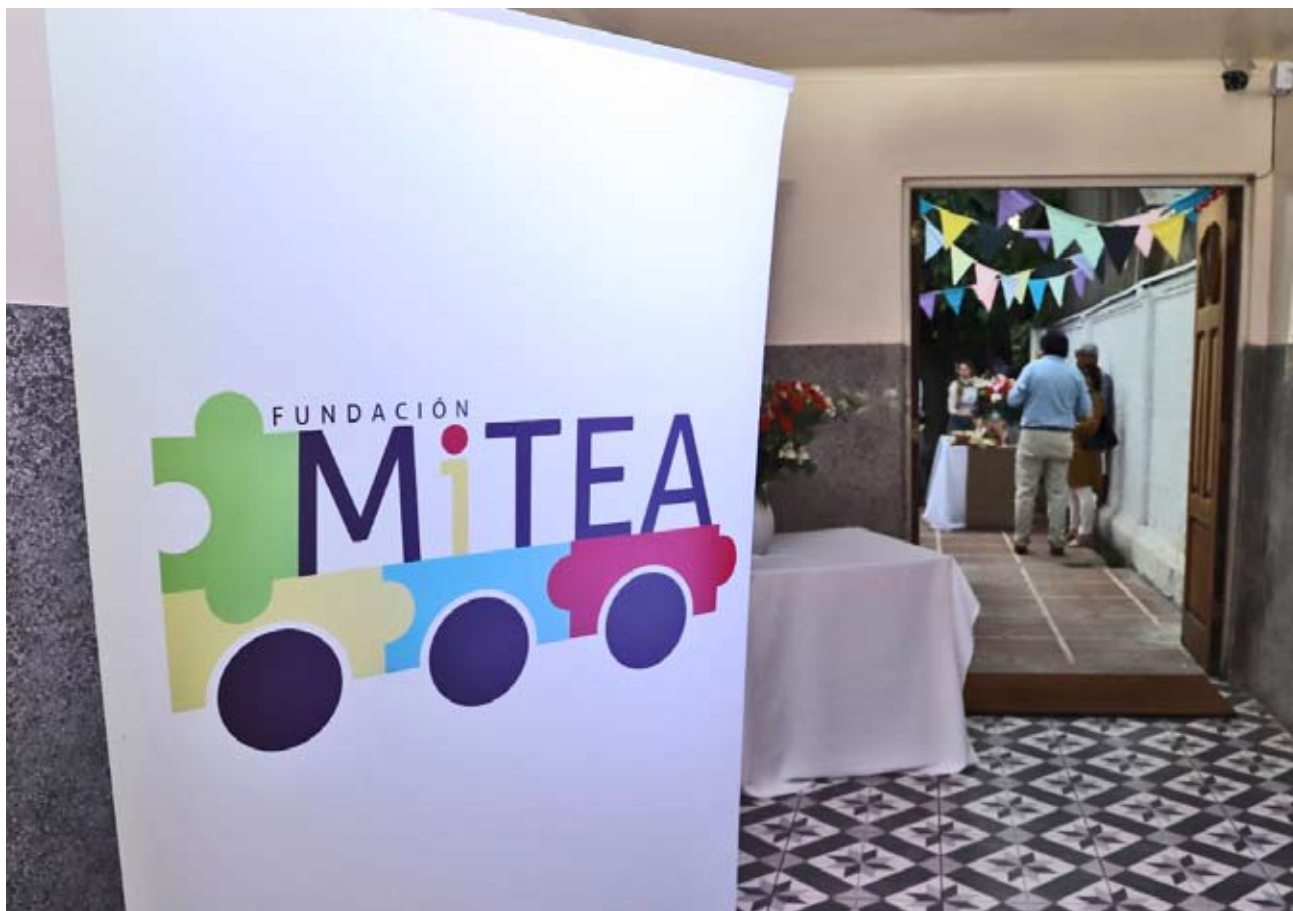
La fundación lleva un año atendiendo de manera presencial.