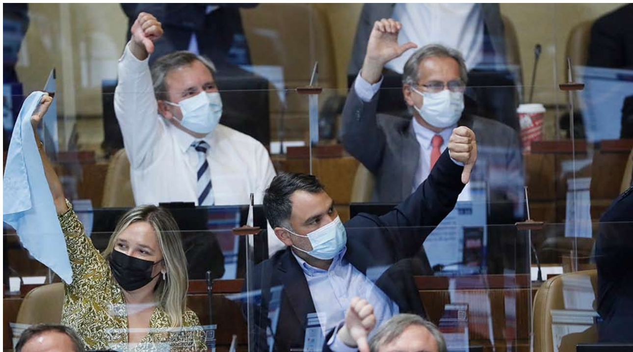
Debido a que el proyecto fue aprobado en general, podría volver a presentarse cuanto antes y no esperar un año.

COMENTA E INFORMATE MÁS EN: www.ladiscusion.cl