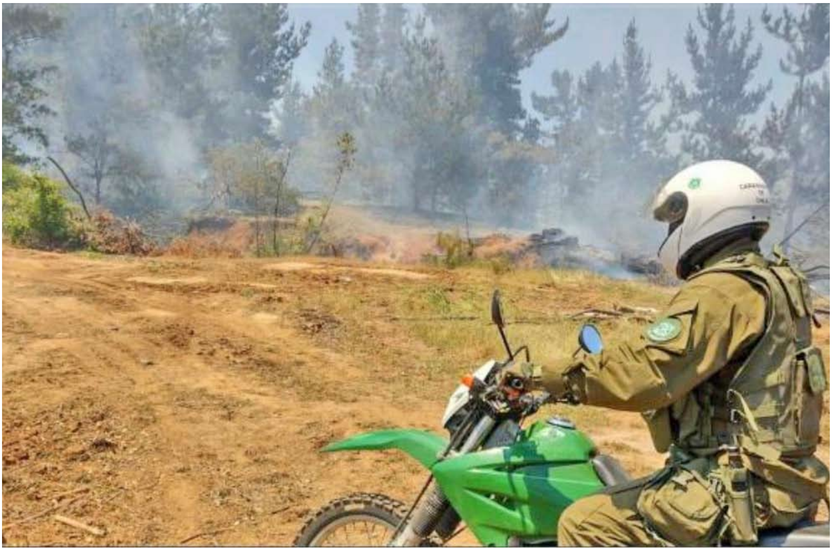
Equipo realiza intervenciones conjuntas de forma semanal, para fortalecer el despliegue en los sectores más críticos.

La Subcomisaría de Coihueco ha recibido hasta la fecha más de 100 llamados por emergencias relacionadas con incendios forestales.