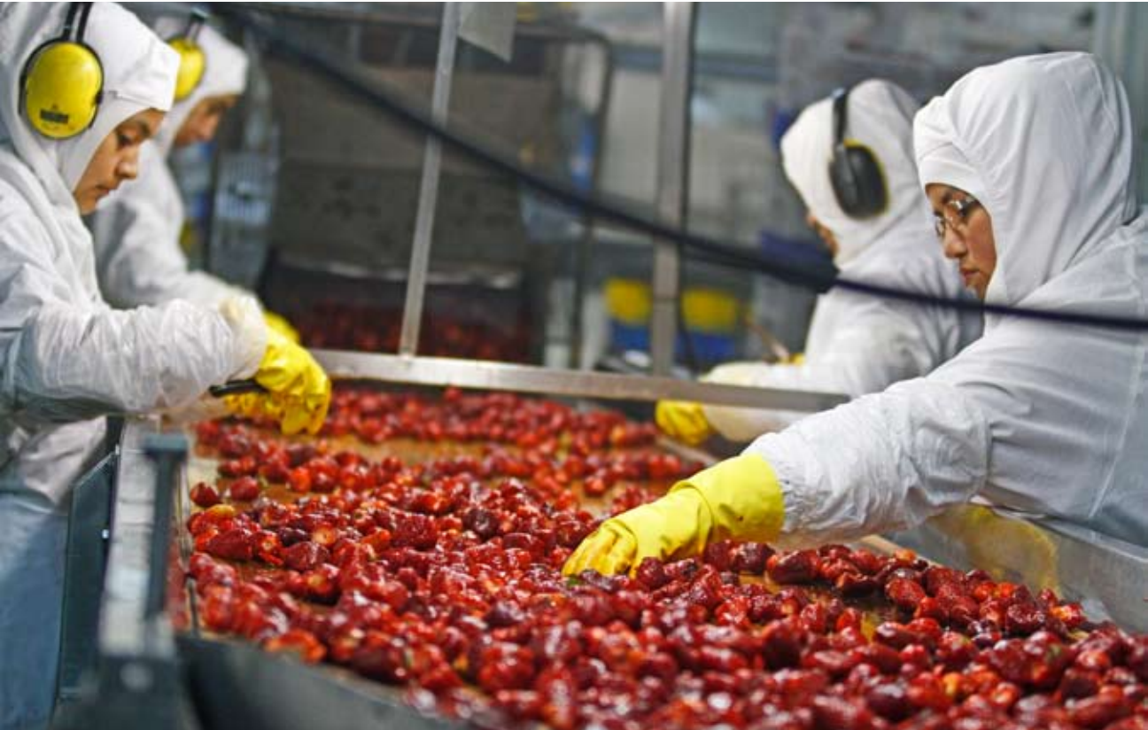
El mayor aumento de personas ocupadas fue entre los 15 y 34 años.

La tasa de desocupación fue 7,4% en la Región de Ñuble, para el trimestre móvil agosto-octubre, anotando una disminución de 2,6 pp. en doce meses, debido a que la fuerza de trabajo (6,7%) aumentó en menor proporción que las personas ocupadas (9,8%). En tanto, las personas desocupadas disminuyeron 21,3%. En doce meses, la estimación del total de las personas ocupadas aumentó 9,8%, incidiendo principalmente por las mujeres ocupadas (17,5%), mientras que los hombres ocupados presentaron una variación de 5,3%. Según tramo etario, el aumento de las personas ocupadas (9,8%) fue incido por 15-34 años (14,0%) y 35-54 años (6,5%). Por categoría ocupacional, trabajadores por cuenta propia (33,6%) y asalariados formales (3,1%), fueron las principales incidencias positivas. La tasa de ocupación in-